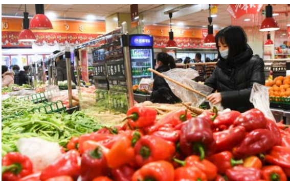
La gente compra vegetales en un supermercado en Yuyang County, en la provincia del suroeste de China, Chongqing, el 5 de febrero de 2020, en medio de un brote de coronavirus que ha hecho que aumenten los precios de los alimentos en el país.

Debemos tener presente que los alimentos representan casi el tercio del gasto de los consumidores chinos y actualmente sus precios han aumentado como por ejemplo: la carne de cerdo que es un insumo principal para la dieta china se disparó en 116% en comparación al año anterior. Otro factor de incremento de los precios en China es el acaparamiento. Según analistas de Capital Economics, la gente se apresura a comprar sus necesidades básicas por temor al tiempo que van estar atrapado en sus hogares por el conoravirus.