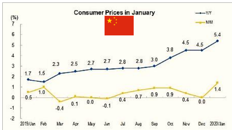
Gráfico N°1: Precios de consumo en China de Enero 2019 a 2020