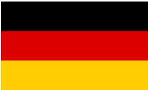
Figura 5:Exportaciones peruanas de jengibre a Alemania mensual al primer cuatrimestre de 2020

En las cifras de exportación mensualizada podemos observar que el mes donde se llegó a exportar más jengibre por valor fue en febrero con US$ 239,753 y con un precio promedio (US$/Kg) de 3.38, uno de los precios promedio más alto al primer cuatrimestre de 2020. Por otro lado, el mes con menor valor exportado en lo que va el año fue en enero US$ 173,858 y con un precio promedio (US$/Kg) de 3.08.