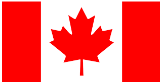
Figura 3:Exportaciones peruanas de jengibre a Canadá mensual al primer cuatrimestre de 2020

El precio promedio más alto se presentó en el mes de marzo con US$ 5.34.