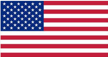
Figura 1: Exportaciones peruanas de jengibre a EE.UU. mensual al primer cuatrimestre de 2020

En las cifras de exportación mensualizadas podemos observar que el mes en el que se llegó a exportar más jengibre fue en febrero con US$ 3.28 millones y con un precio promedio (US$/Kg) de 2.33. Por otro lado, el mes con menor valor exportado en lo que va el año fue en abril US$ 1.39 millones y con un precio promedio (US$/Kg) de 2.57 uno de los más alto al primer cuatrimestre de 2020.