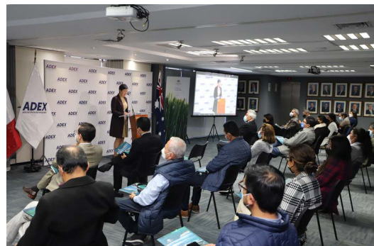
La embajadora de Australia en Perú, Maree Rin participó en el Foro 'Beneficios y oportunidades del TLC entre Australia y Perú'.

A su turno, el consejero de Agricultura de la Embajada de Australia, Ian Mortimer, detalló que su oferta está liderada por carne vacuna y ovina, vino, dispositivos médicos y productos farmacéuticos y de papel; también