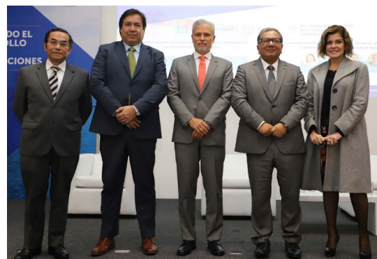
Los líderes gremiales, políticos y empresariales resaltaron las grandes oportunidades que ofrecen las exportaciones.

En el conversatorio ‘Liderando el desarrollo de