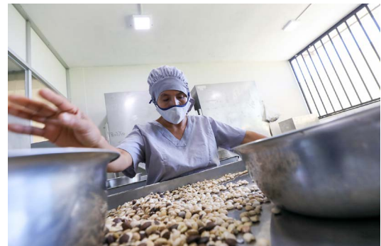
Las pymes serán las más beneficiadas por el TLC entre Perú y Australia.

En su exposición ‘Oportunidades no aprovechadas con Australia’, Vásquez precisó que el TLC brinda a las medianas, pequeñas y microempresas instrumentos para beneficiarse en igualdad de condiciones. “A través de los gobiernos se pone a disposición de los empresarios canales de cooperación, asistencia técnica y fortalecimiento de capacidades a fin de fortalecer a las pymes de ambas naciones”, dijo.