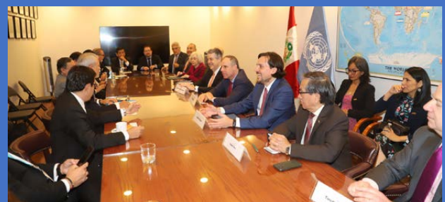
Otra de las reuniones fue con la Peruvian-American Associations, organización dedicada a promover la inversión, el comercio y el intercambio cultural entre EE.UU. y Perú.