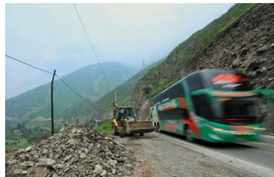
La infraestructura vial en muchas regiones quedó totalmente dañada tras las lluvias.

A fin de avanzar en la mejora de la infraestructura,