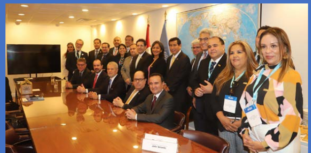
Los integrantes de ADEX tuvieron un encuentro con los representantes de HelpPeru, comprometida a mejorar el acceso de todos los peruanos a buenos servicios de educación y salud, empoderar a las mujeres y fomentar el respeto medioambiental.