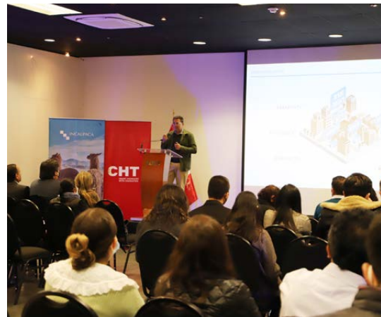
El XVIII Foro Textil, realizado en el 2022, tuvo una gran acogida luego de dos ediciones virtuales por la pandemia.

Bajo el lema ‘Your Clothes tell a Story’ (tu ropa cuenta una historia), el evento dará cita a expositores nacionales e internacionales de