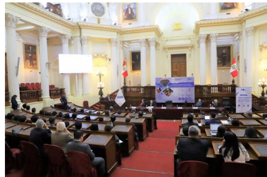
El evento contó con la participación de empresarios, congresistas, estudiantes y público en general.

Entre las acciones necesarias para desarrollar la industria forestal, mencionó la importancia del proyecto de ley N° 4141/2022-CR, el cual precisa que la comercialización de créditos (bonos) de carbono generados en proyectos de Reducción de Emisiones derivadas de la Deforestación y Degradación de los bosques (REDD+), son servicios ecosistémicos y deben estar incluidos en los alcances de la Ley N° 27037 (Ley de Promoción de la Inversión en la Amazonía).