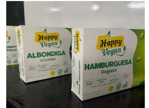
Kobefood elabora y comercializa productos veganos.

Frigoríficos Kobefood es una empresa peruana 100% vegana cuya visión es ser líder en la innovación, elaboración y comercialización de productos veganos a nivel nacional e internacional.