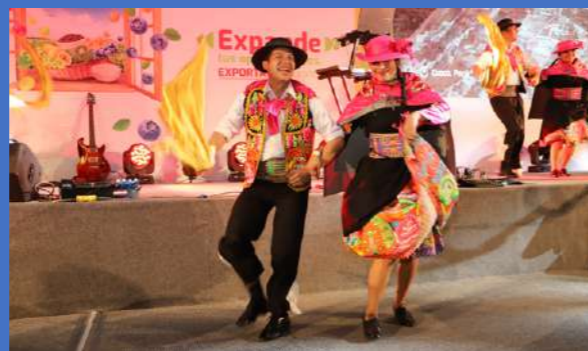
Hermosas danzas típicas se lucieron en el cóctel con motivo de la feria.