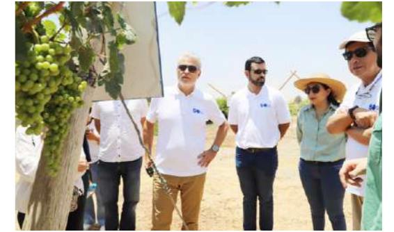
ADEX visitó las plantas de las empresas asociadas, una de ellas fue Bodega Santa María Magdalena