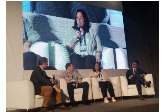
El panel ‘Estrategias para la efectiva exportación de alimentos desde Perú’, se realizó en el marco de las conferencias magistrales de la feria Expoalimentaria 2023.

programas de despacho y reducir costos en el transporte.