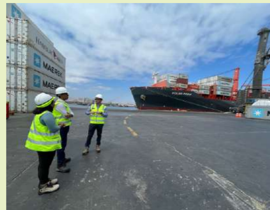
TPA es una opción logística importante para el comercio exterior.

“Ofrecemos una eficiente conectividad marítima con 8 líneas navieras con frecuencias semanales, tarifa cero en algunas modalidades de despacho, rutas de acceso seguras y una moderna tecnología, que nos permite operar en épocas de marejada. Asimismo, otorgamos a nuestros clientes una lista de proveedores confiables que ya operan en el puerto”, señaló.