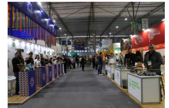
La Expoalimentaria 2024 se realizará del 25 al 27 de setiembre en el Centro de Exposiciones del Jockey.

En la feria se realizaron 2 mil 600 citas de negocios, 1,600 más que en la edición del 2022, y se hicieron presentes 580 expositores entre nacionales y extranjeros.