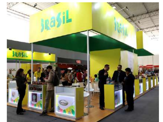
El pabellón Brasil fue el más numeroso con 27 empresas que mostraron lo mejor de su oferta exportable.

“Como Ministerio de Agricultura impulsamos la participación de nuestros empresarios en este tipo de eventos. Cada año, apoyamos 13 ferias