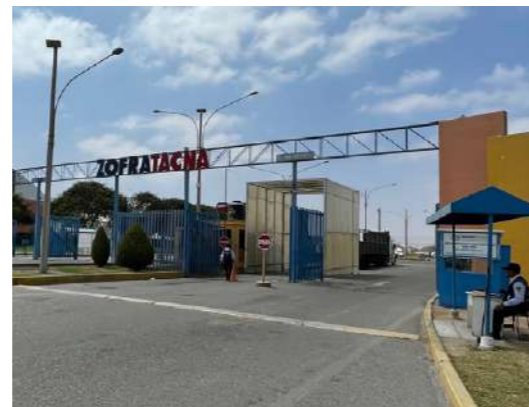
Zofratacna ofrece una serie de ventajas a empresas de diversos rubros.

Agregó que, con el fin de potenciar las capacidades del sector productivo tacneño, la Dirctetur realiza una serie de actividades, como el programa de 'Internacionalización