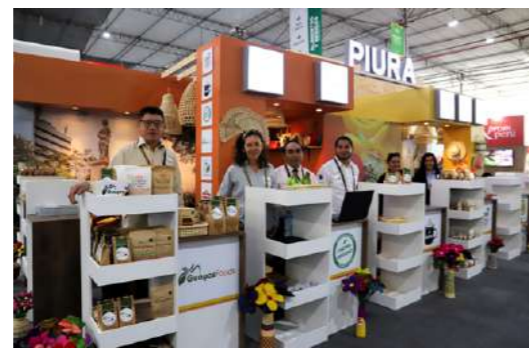
La delegación de Piura fue una de las más numerosas.

El café piurano atrajo a compradores de Corea del Sur, Francia y Paraguay. Según el director de Competitividad Agraria de la Dirección